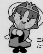
三郷町イメージキャラクター たつたひめ

参加者の皆様には ・エコバッグ ・田辺三菱製薬(株)提供 アスパラドリンク などの記念品を進呈!