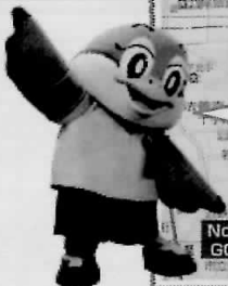
大阪府広報担当副知事もずやん